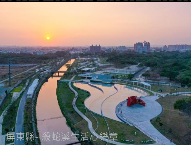
屏東縣-殺蛇溪生活心樂章