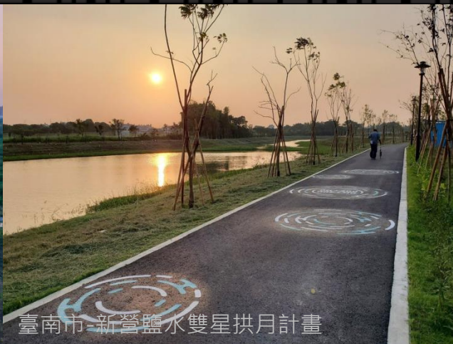
臺南市-新營鹽水雙星拱月計畫