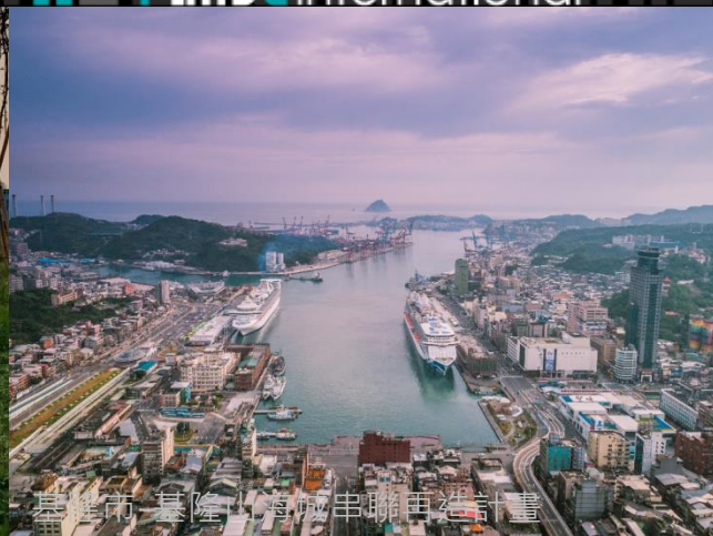
基隆市-基隆山海城串聯再造計畫