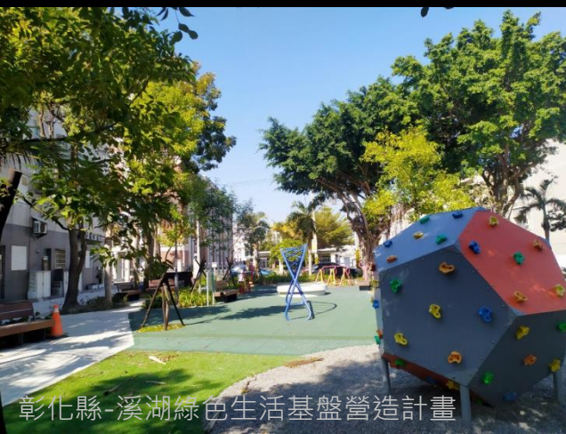
彰化縣-溪湖綠色生活基盤營造計畫