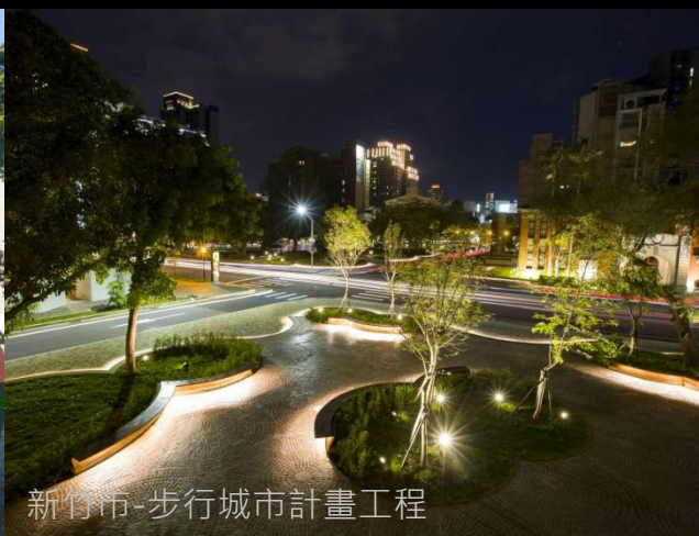
新竹市-步行城市計畫工程