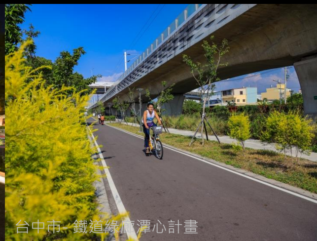
台中市-鐵道綠廊潭心計畫